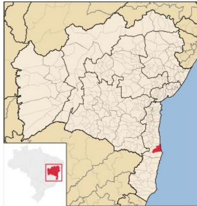
Localização de Canavieiras 6

Nos levantamentos prévios e diálogos preparatórios para a realização da missão, foi identificado como maiores ameaças à RESEX o desmatamento ilegal, a carcinicultura em áreas próximas aos limites da RESEX e ameaças à vida de membros das comunidades extrativistas. Diante desse cenário, o Grupo de Trabalho definiu, em diálogo com lideranças locais, um roteiro de visita a quatro comunidades, além de audiência na sede da Associação AMEX (Associação Mãe dos Extrativistas) e reunião com representantes de órgãos federais, estaduais e municipais. O roteiro da missão buscou estabelecer um processo de escuta plural para identificação de possíveis situações de violação dos direitos humanos dos moradores da RESEX.