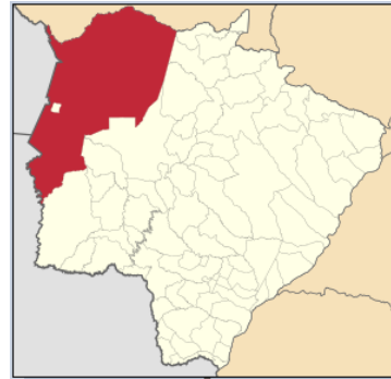
Localização de Cáceres 9

Em um território dominado pelas águas, as comunidades tradicionais de pantaneiras e pantaneiros se estabeleceram no local, desenvolvendo formas alternativas de sobrevivência interconectadas com elas e os seus movimentos, transmitindo por gerações o conhecimento tradicional das estratégias de ocupação e manejo do território tradicional. Além disso, de forma geral, essas comunidades possuem um conhecimento tradicional que lhes permite interagir com a biodiversidade e entendê-la não como um recurso natural, mas como um conjunto de seres vivos que tem um valor de uso e um valor simbólico, integrado numa complexa cosmologia e no contexto cultural (ALMEIDA & SILVA, 2011 10 ).