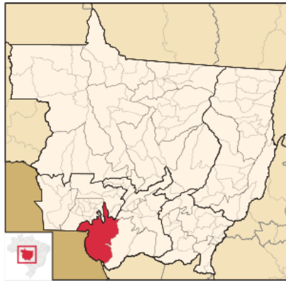
Localização de Cáceres 8